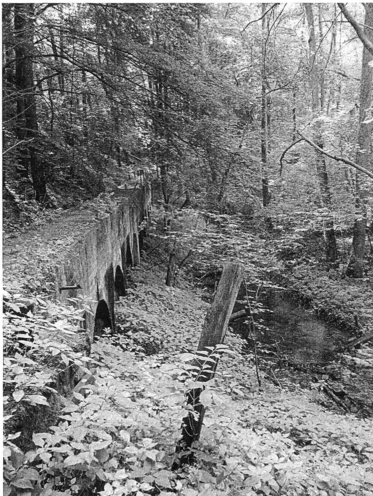
Zdjęcie nr 2 - Mostek wzdłuż Strugi Jeziornej