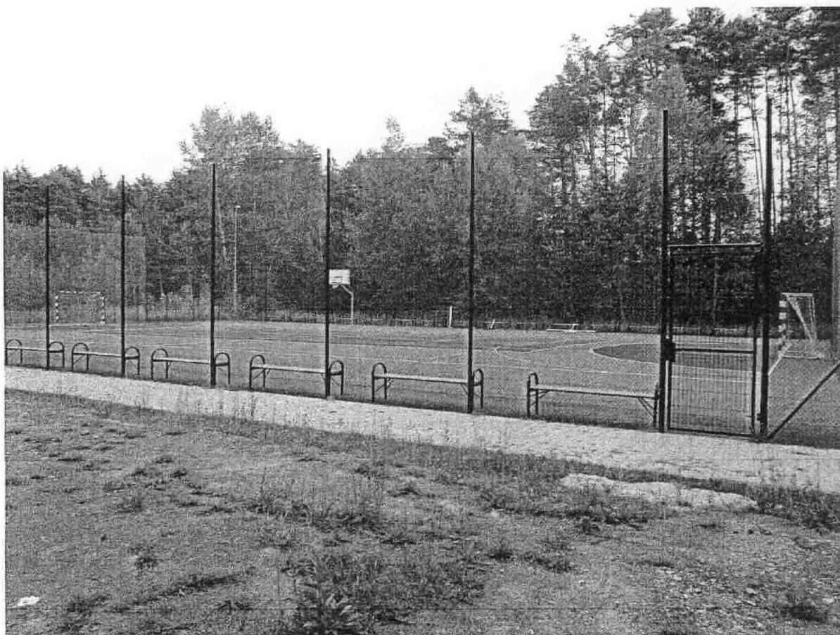
Zdjęcie nr 1 - Boisko sportowe „Orlik”