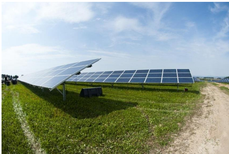
Rys. 1. Przykład drogi wewnętrznej.

Na czas realizacji budowy jak i późniejszej likwidacji, na działkach inwestycyjnych nie przewiduje się wyznaczenia zaplecza budowy. Ze względu na brak konieczności niwelacji gruntu oraz zastosowaną technologię budowy nie będzie wymagała przygotowania „specjalnego” zaplecza, czy relatywnie dużego parkingu. Jeżeli powstanie zaplecze budowy to będzie ono zlokalizowane bezpośrednio przy drodze dojazdowej i wjeździe na teren inwestycji i zostanie zlikwidowane w miarę postępu prac związanych z budową konstrukcji wsporczej i instalacji pozostałych elementów instalacji.