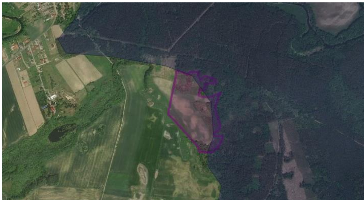
Rys. 5. Mapa lokalizacji terenu przedsięwzięcia na tle korytarzy ekologicznych.

Teren planowanej inwestycji znajduje się na granicy z obszarami korytarzy ekologicznych. Ze względu na swój niewielki i punktowy charakter inwestycja nie będzie stanowiła bariery dla zwierząt o wysokich wymaganiach przestrzennych, dla których przede wszystkim projektuje się korytarze migracyjne, takich jak wilk, ryś, żubr czy łось. Kluczowym zagrożeniem dla prawidłowego funkcjonowania i drożności korytarzy ekologicznych są duże inwestycje liniowe np. autostrady, lub linie kolejowe.