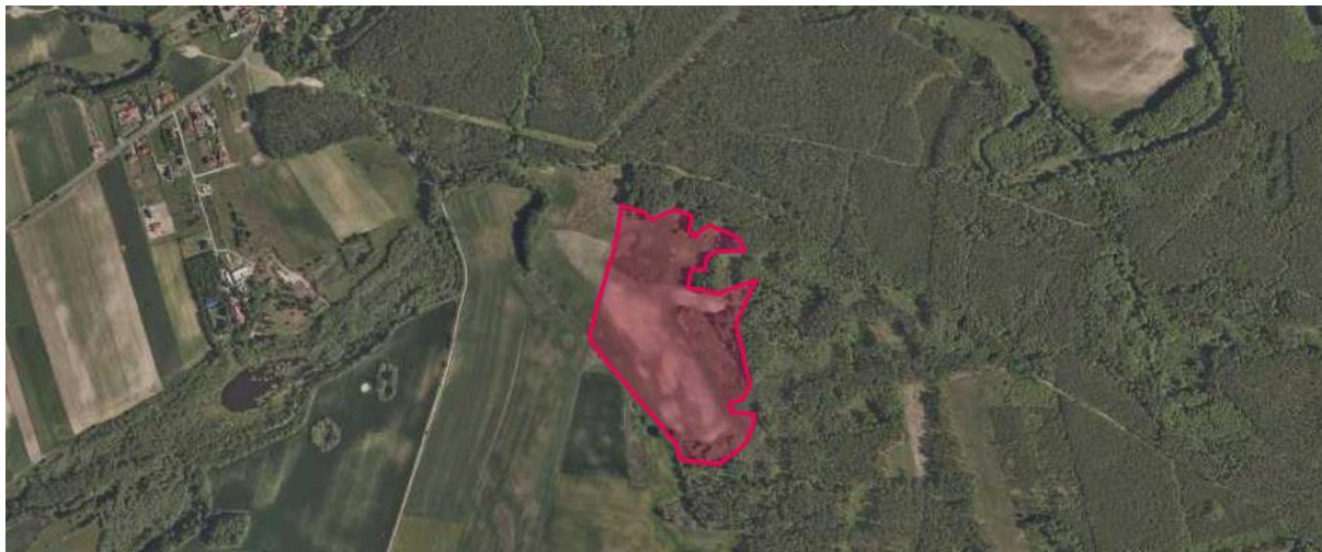
Rys. 3. Widok na działkę realizacyjną i tereny sąsiadujące

Teren przyszłej farmy fotowoltaicznej obecnie, w większej części jest terenem rolnym. Na sąsiednich terenach również można spotkać uprawy. Uprawy stanowią głównie zboża. Na terenie przedsięwzięcia brak gatunków chronionych, drzew, krzewów.