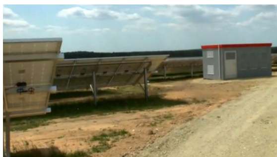
Rys. 2. Konstrukcja instalacji fotowoltaicznej wraz z infrastrukturą elektroenergetyczną, drogową -przykład podobnej instalacji.

Teren pierwotnie przeznaczony na miejsce tymczasowego składowania elementów instalacji fotowoltaicznej (np. przy rozładowywaniu samochodów dostawczych) zostanie w miarę postępu prac zlikwidowany i na jego miejscu zostaną zamontowane elementy instalacji.