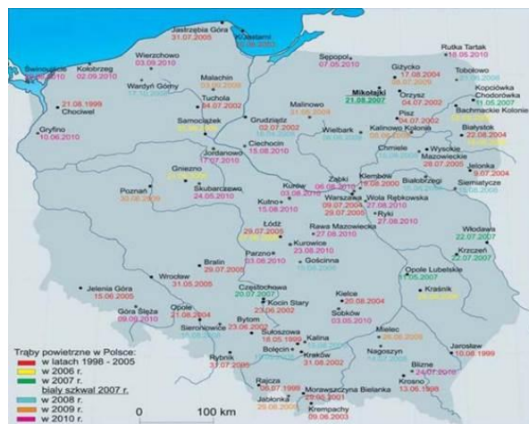
Rys. 8. Występowanie trąb powietrznych w Polsce w latach 1998-2010. Źródło: Strategiczny plan adaptacji dla sektorów i obszarów wrażliwych na zmiany klimatu do roku 2020 z perspektywą do roku 2030. Ministerstwo Środowiska 2013.

Źródło: Strategiczny plan adaptacji dla sektorów i obszarów wrażliwych na zmiany klimatu do roku 2020 z perspektywą do roku 2030. Ministerstwo Środowiska 2013