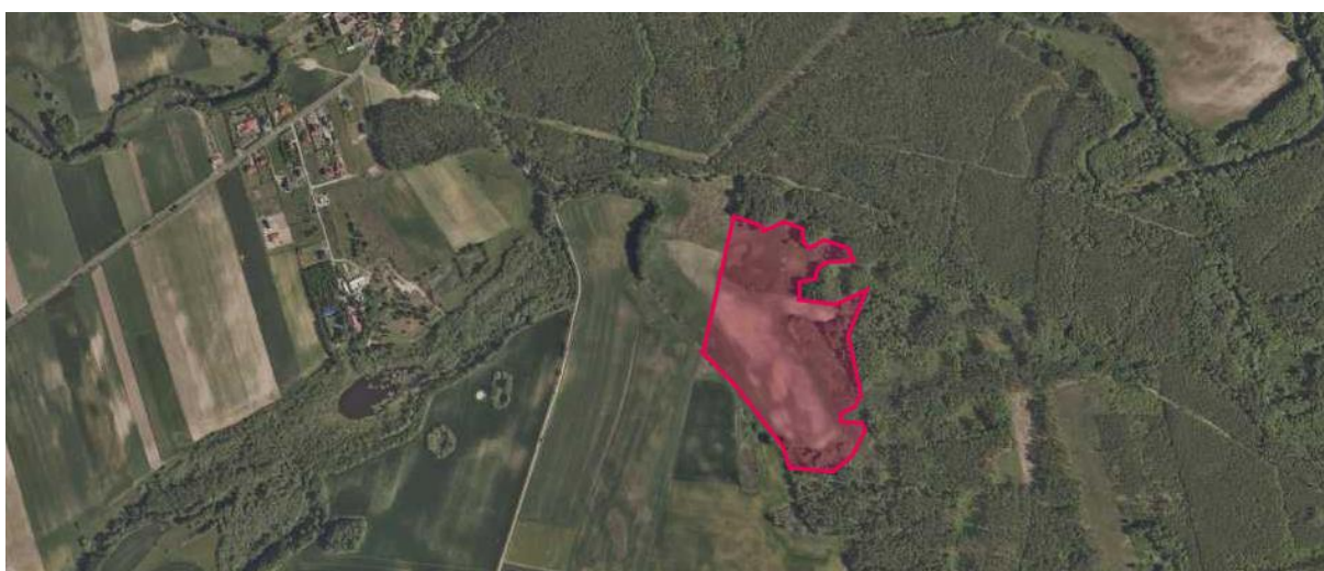
Rys. 7. Mapa krajobrazu obszaru lokalizacji przedsięwzięcia.

Realizacja przedsięwzięcia polegającego na budowie elektrowni fotowoltaicznej spowoduje zmianę krajobrazu działki, na której będzie zrealizowane przedsięwzięcie. Elektrownia fotowoltaiczna, ze względu na niewielką wysokość instalacji nie będzie stanowiła dominanty w krajobrazie i będzie widoczna jedynie z najbliższej odległości zwłaszcza, że elektrownia fotowoltaiczna planowana jest na terenie przekształconym antropogenicznie.