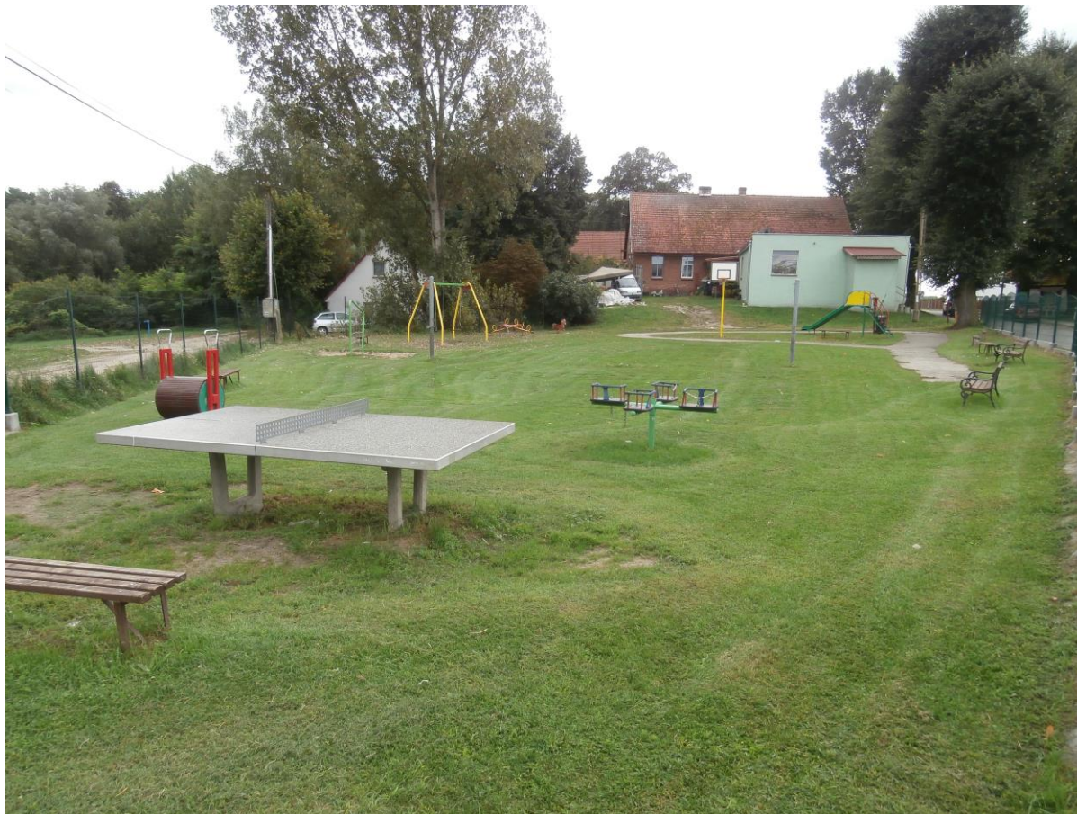
Plac zabaw w Żółwinie. Zasoby Urzędu Miejskiego w Międzyrzeczu

W Żółwinie funkcjonuje gminny plac zabaw wraz z boiskiem do piłki siatkowej zlokalizowany przy drodze powiatowej nr 1328 F.